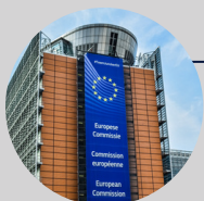
• Commission européenne