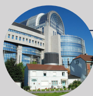
• Parlement européen