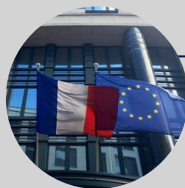
• Représentation permanente française