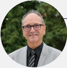
Pierrick Lozé , sous-préfet de Lure

"L'IHEMRu m'est apparu comme un excellent complément à mes fonctions de sous-préfet. Il me permet de prendre du recul, de disposer de cette distance nécessaire, tout en bénéficiant d'un apport théorique indispensable à mon quotidien".