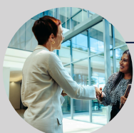
• Groupes d'influence et lobbyistes au sein des institutions européennes